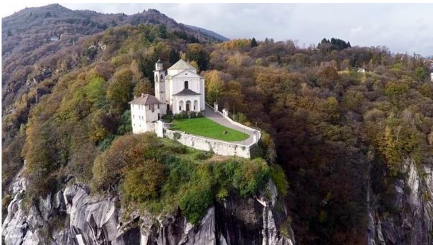
Santuario Madonna del Sasso