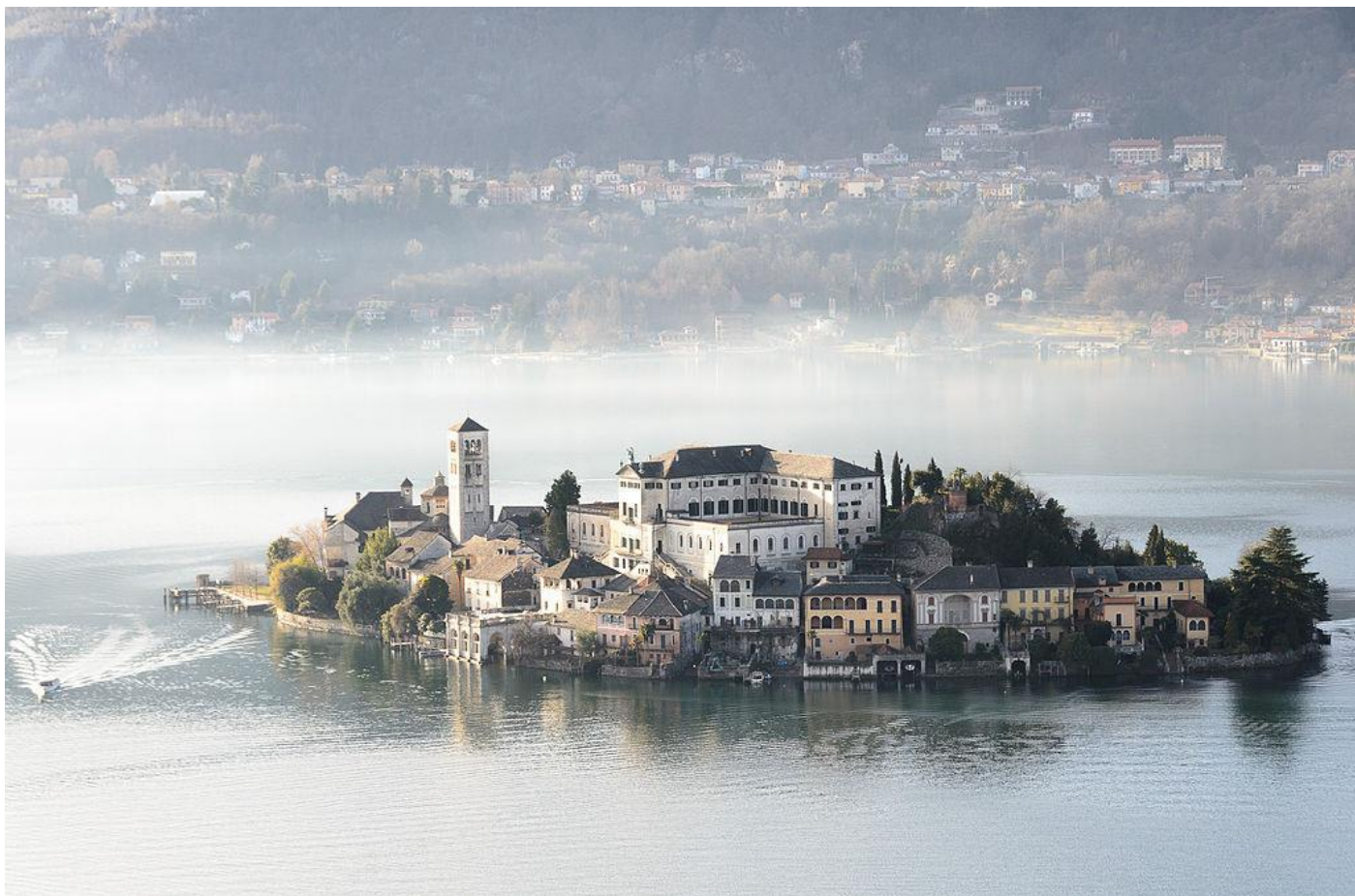
Isola di San Giulio