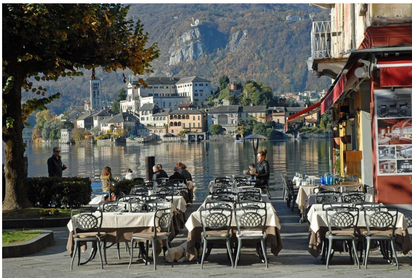
Scorcio della piazzetta della darsena di Orta San Giulio